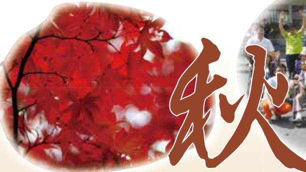
青森田中学園翔麗祭見学