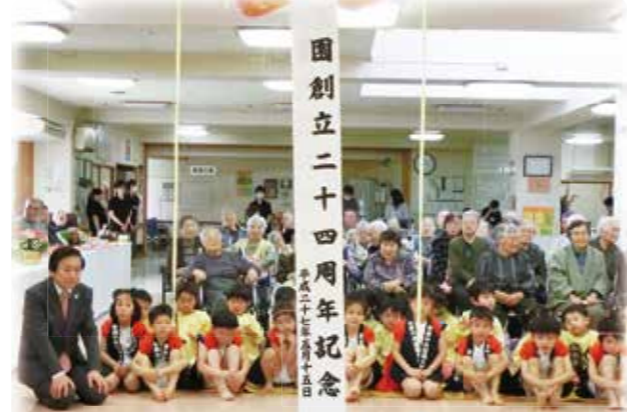
園創立記念誕生会