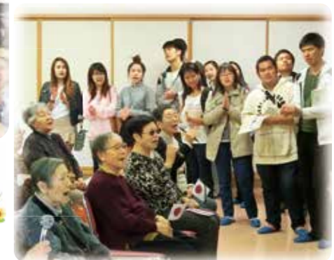
タイ国の皆様来園