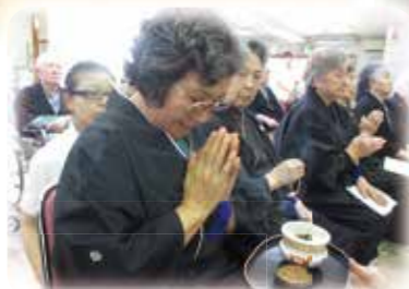
春と秋の彼岸法要会